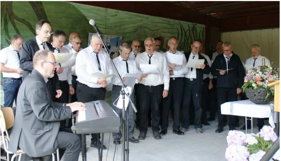
Auch der Männergesangverein Diersheim nahm am Gottesdienst teil.