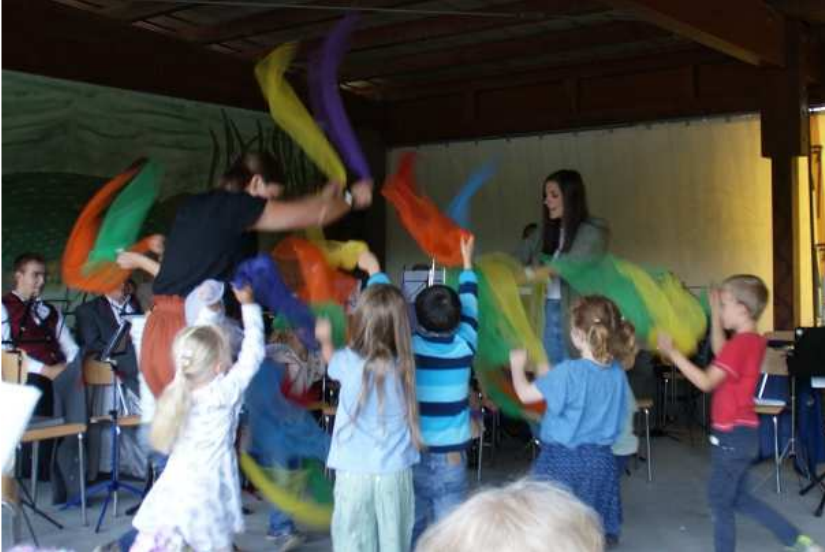
Schwungvoller Gruß vom Evangelischen Kindergarten Diersheim