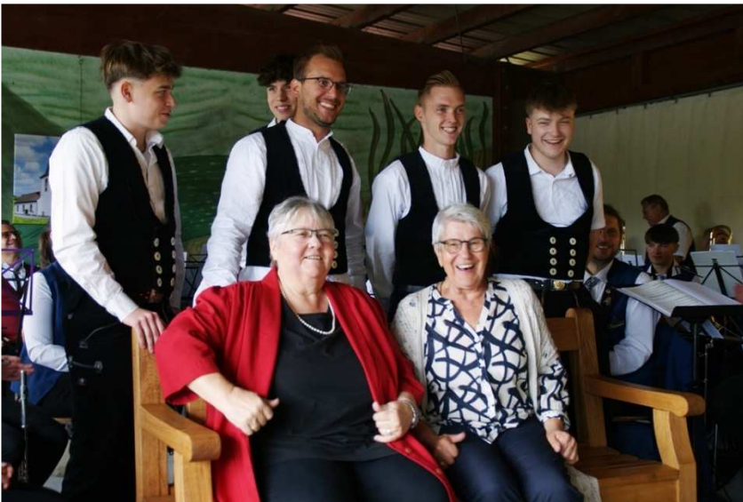
Und nun ist es Zeit fürs Rentnerbänkel